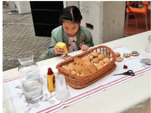
Mézeskalács díszítő műhely gyerekeknek/ Krašenje medenjakov, delavnica za otroke

folyó pályázat programjait. 11-én Muraszombatban tartottuk meg a projektben résztvevő egyesületek, csoportok találkozását. Mégtörtént a program és a részvétel összeállítása. Minden egyesületnek öt helyen kellett részt venni és egy saját rendezvényt szervezni. Szeptember 8-án Muraszombatban, a vár udvarán állítottuk ki a hímzéseinket és az ottani rendezvényen résztvevő gyerekeknek mézeskalácsdíszítő műhelymunkát tartottunk. 9-én Puconcin a Dődöllijadán is kiállítottuk a hímzéseinket és a versenyen dődöllét főztünk. A harmadik résztvevős 13-án, Salban a Korenika Őko-szociális gazdaságon rendezett összejövetelen volt. Ott a hímzéseinket állítottuk ki és az érdeklődőknek, akik Szlovénia minden tájegységéről voltak, bemutattuk a munkánkat. 14-én Gornji Petrovcin lettek bemutatva a hímzéseineink. 22-én a hagyományos szüreti felvonulás lett megtartva. Kerkáskápolnáról indulva, Senyeházán, Dávidházán, Hodoson átvonulva a hodosi Művelődési ház előtt volt a menet záróprogjanja. A kultúrprogramot a pályázatban résztvevő csoportok, ki ki a maga módján színesítette. A résztvevőket vacsorával vendégeltük meg. 27-én a projekt zárórendezvényén Cankován mutathattuk be a kézimunkáinkat. Minden bemutatkozásunkon a látogatóknak bemutattuk a munkánkat, egyesületünket és a szórólapok segítségével Hodos Községet is.