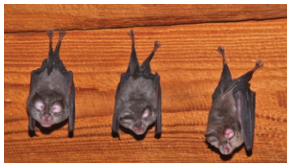
Mali podkovnjaki - naši občasni sosede na podstrešjih hiš

Na žalost pa ljudje s svojimi posegi netopirjem