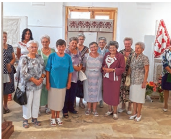
Körömendü évforduló/ Na obletnici v Körömendü

Mindenhonnan elégedetten és sok sok szép élménnyel tértünk haza.