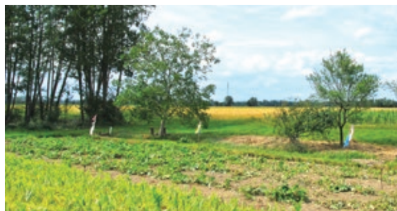
Buče za mejico še vedno rastejo