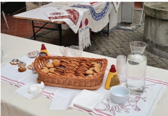
A Muraszombati vár udvarán/ Na dvorišču murskosoboškega grada

Szeptember eléggé tevékenyen kezdődött. Ebben a hónapban kellett lebonyolítani a Las Goričko keretében