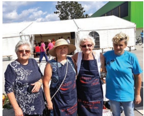
Dődöllét főztünk/Kuhale smo na Dődöllijadi

folyó pályázat programjait. 11-én Muraszombatban tartottuk meg a projektben résztvevő egyesületek, csoportok találkozását. Mégtörtént a program és a részvétel összeállítása. Minden egyesületnek öt helyen kellett részt venni és egy saját rendezvényt szervezni. Szeptember 8-án Muraszombatban, a vár udvarán állítottuk ki a hímzéseinket és az ottani rendezvényen résztvevő gyerekeknek mézeskalácsdíszítő műhelymunkát tartottunk. 9-én Puconcin a Dődöllijadán is kiállítottuk a hímzéseinket és a versenyen dődöllét főztünk. A harmadik résztvevős 13-án, Salban a Korenika Őko-szociális gazdaságon rendezett összejövetelen volt. Ott a hímzéseinket állítottuk ki és az érdeklődőknek, akik Szlovénia minden tájegységéről voltak, bemutattuk a munkánkat. 14-én Gornji Petrovcin lettek bemutatva a hímzéseineink. 22-én a hagyományos szüreti felvonulás lett megtartva. Kerkáskápolnáról indulva, Senyeházán, Dávidházán, Hodoson átvonulva a hodosi Művelődési ház előtt volt a menet záróprogjanja. A kultúrprogramot a pályázatban résztvevő csoportok, ki ki a maga módján színesítette. A résztvevőket vacsorával vendégeltük meg. 27-én a projekt zárórendezvényén Cankován mutathattuk be a kézimunkáinkat. Minden bemutatkozásunkon a látogatóknak bemutattuk a munkánkat, egyesületünket és a szórólapok segítségével Hodos Községet is.